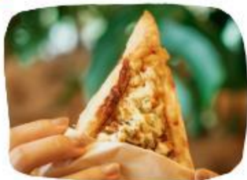
やんばる産パイナップル