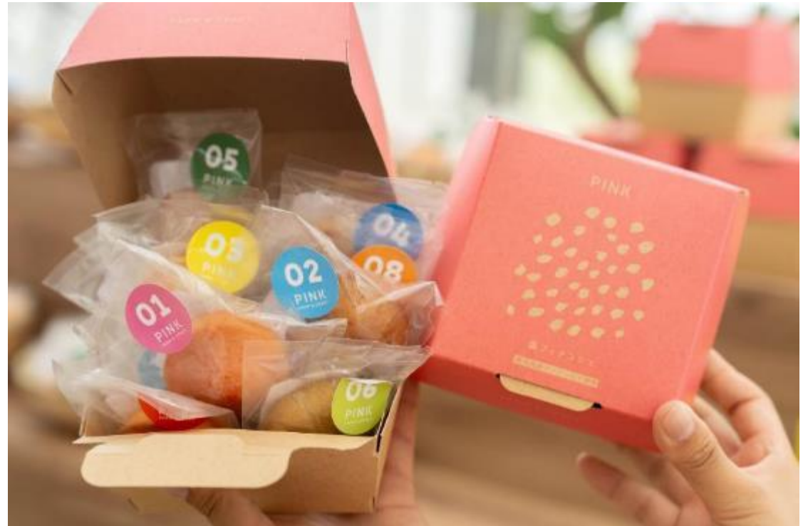
屋我地島で精製されたピンクソルト使用