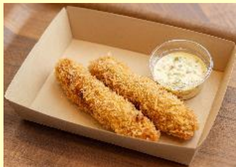
パイとん(アグー豚)のメンチカツ