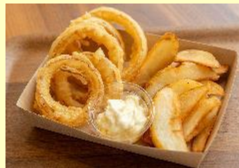
屋我地の塩フレンチフライ