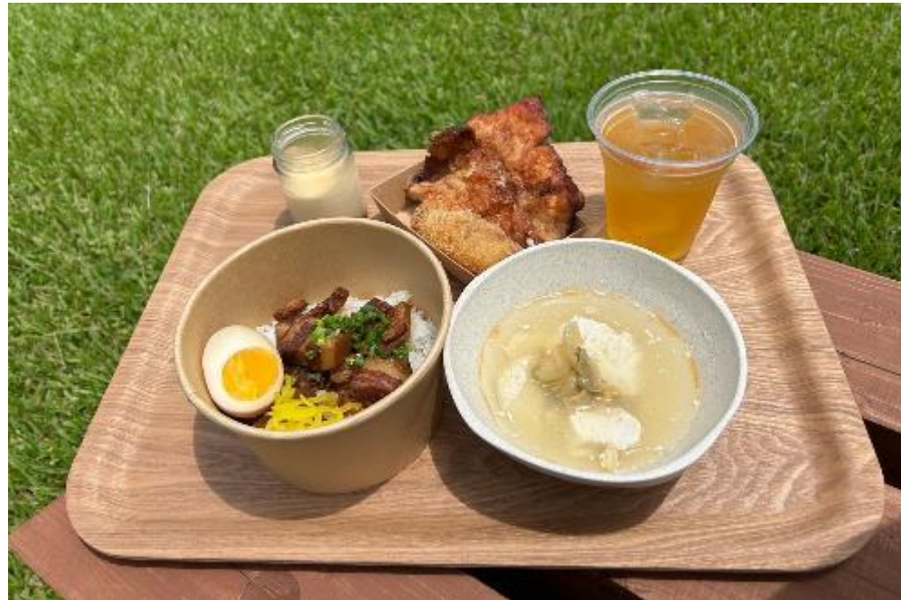
ルーローハンとこだわりのアラカルトセット