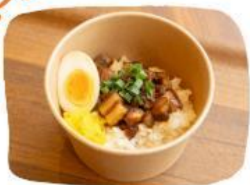
琉香豚 (りゅうかとん)