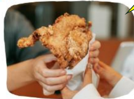
やんばるハーブ若鶏