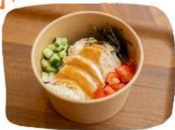
やんばるハーブ若鶏