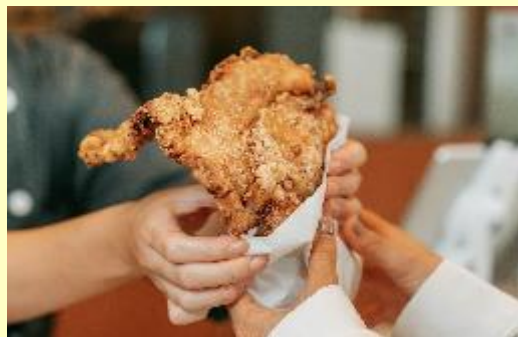
やんばるハーブ若鶏のダージーパイ