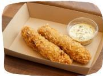
パイとん (アグー豚)