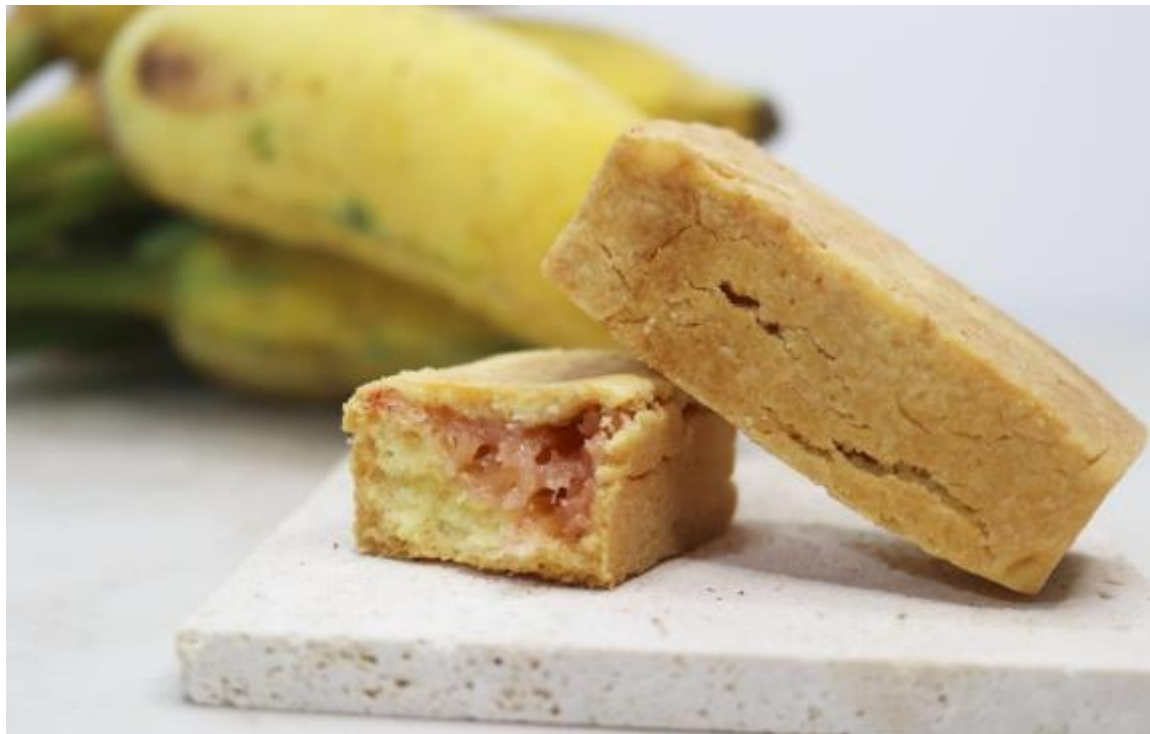
やんばる産アップルバナナ使用